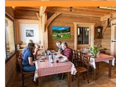
Table paysanne / casse croûte paysan "Au rythme du troupeau"

Le restaurant Les Caudalies vous offre une cuisine traditionnelle et raffinée avec deux formules : les menus du jour servis "côté bar" tandis que la carte et les menus seront proposés "côté restaurant".